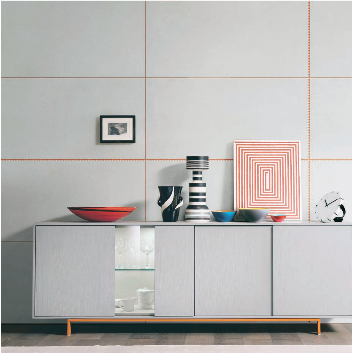
Qui sopra Zip, disegnata per Ceramica Bardelli e, sotto, La Fontana, by The.ArtCeram